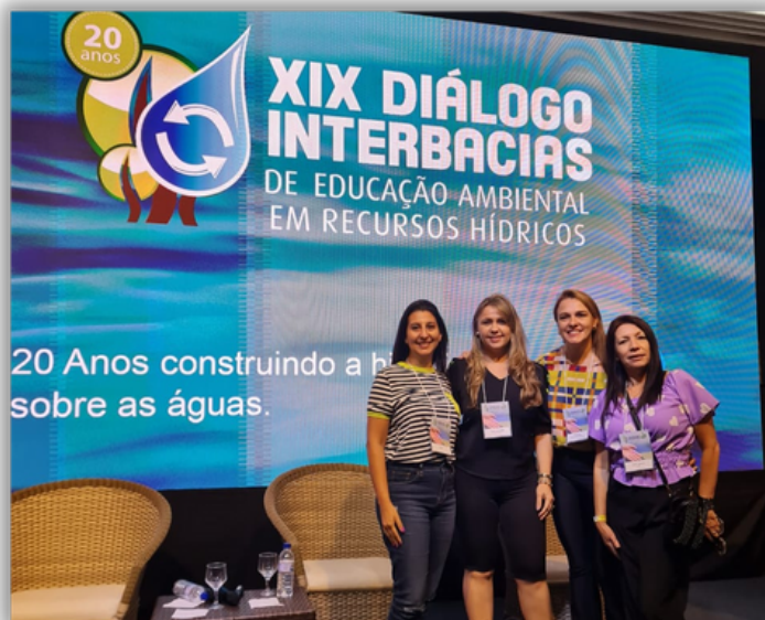
Legenda: XIX Diálogo Interbacias - 18 a 20 de outubro